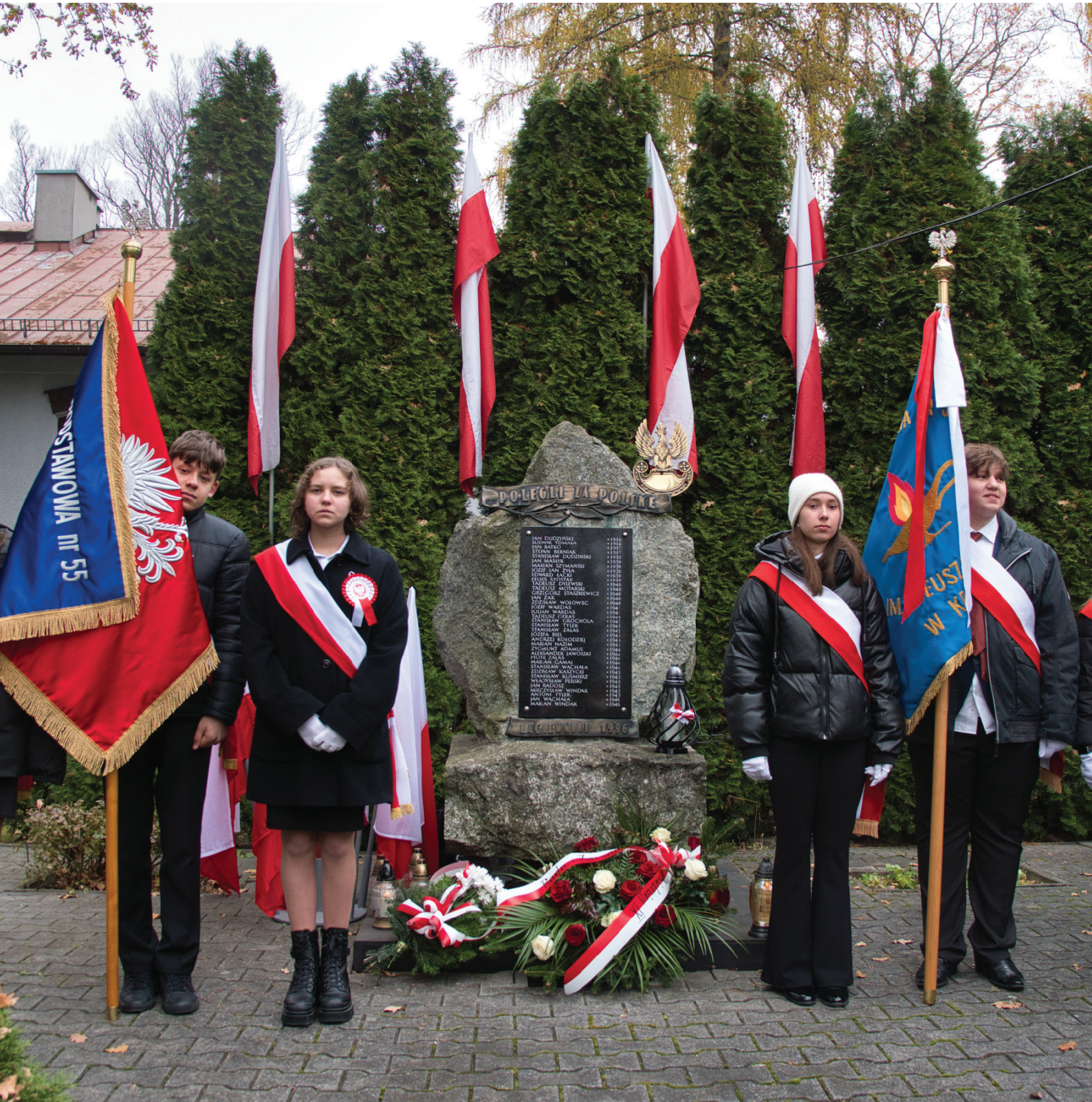
Obchody Święta Niepodległości w Łągiewnikach